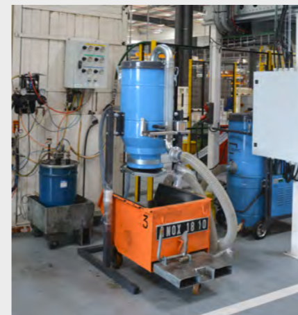
Aspiration avec trémie à ouverture totale collecte déportée dans contenant client