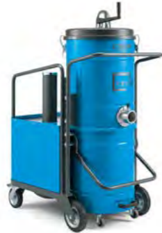
KB2 KB3 KB4S KB4P KB5S KB5P