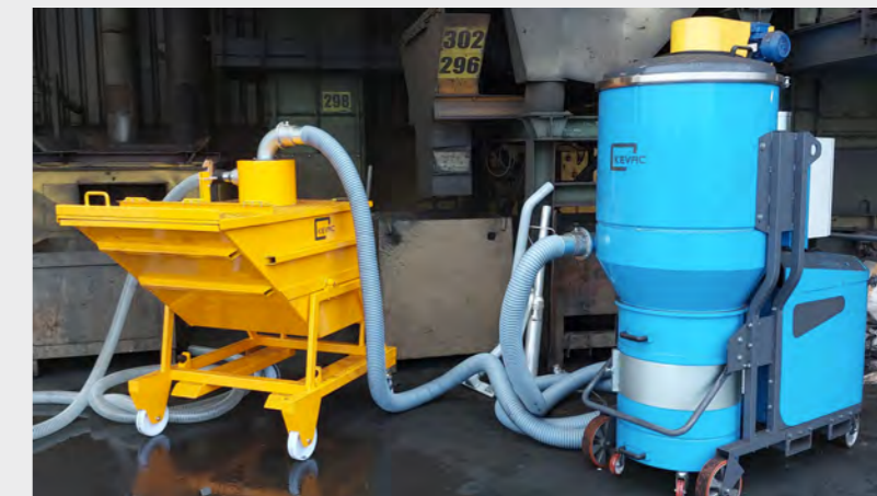
Aspiration de sable avec collecte en benne de 600 litres