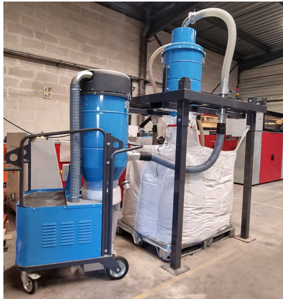
Aspirateur industriel avec filtre absolu, trémie cyclonique, collecte en bigbag, utilisation sur imprimante 3D sable