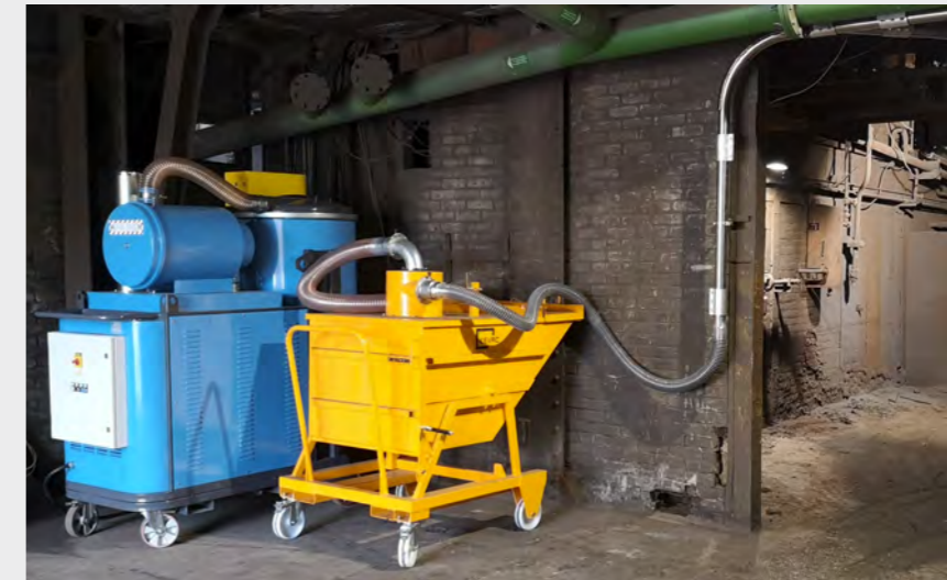
Réseau centralisé pour l'aspiration sur plancher de coulée