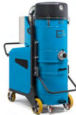
K7 K9 K11S K11P K13 K15