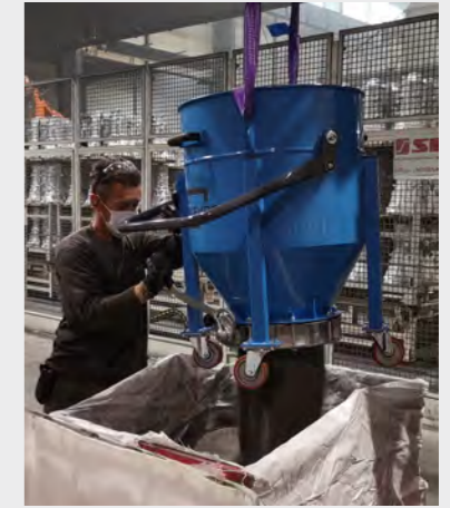
Vidange de grenailles aisée avec cuve équipée d'un fond ouvrant