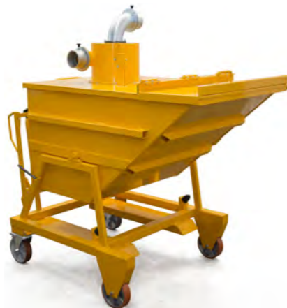
Benne de 500 à 2000 litres