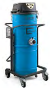
KMB2 KMB2/90 KMB3 KMB3/50