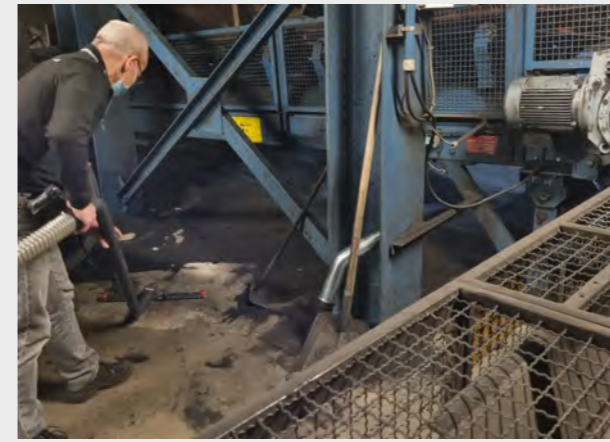
Aspiration de sable sous convoyeur