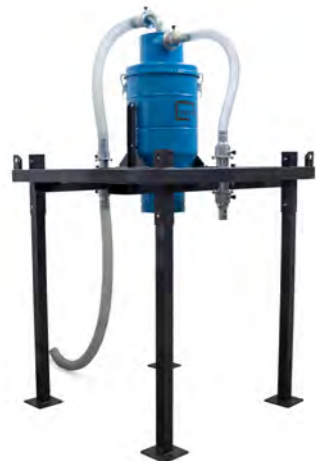
Trémie cyclonique vidange par clapet