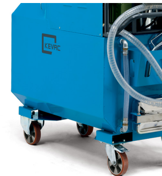
Passage de fourche pour transport avec chariot élévateur