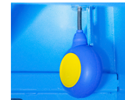
Capteur de niveau