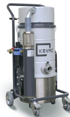
OPTION 1 : Cuve en INOX 304