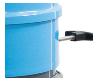
Poignée de décolmatage