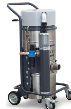
OPTION 2 : Cuve et chambre filtrante en INOX 304