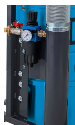
Régulateur de pression d'air