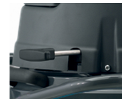
Système de décolmatage ergonomique