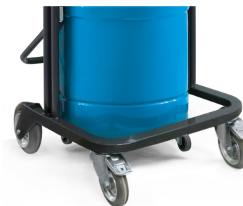
Châssis robuste avec roues de grand diamètres et freins