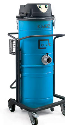
KMB2 avec possibilité de cuve en 50 ou 90 litres