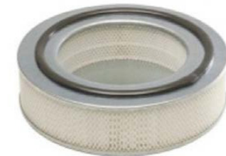
Option : Filtre absolu en amont (HEPA) avec filtre M