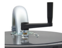
Poignée de décolmatage