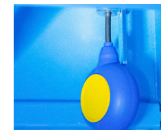
Capteur de niveau