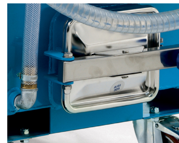
Trou d'homme pour faciliter le nettoyage