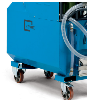
Passage de fourche pour transport avec chariot élévateur