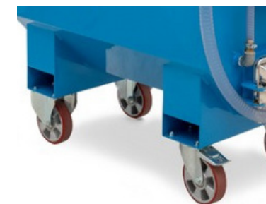
Fourreaux de fourches