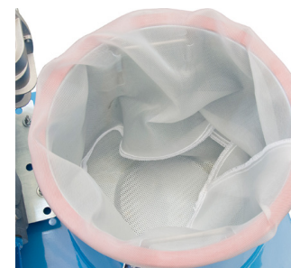
Panier à copeaux avec filtre en nylon (optionnel)