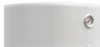
Indicateur de colmatage