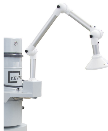
OPTION : Bras d'aspiration