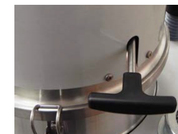
Système de décolmatage ergonomique