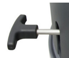
Système de décolmatage ergonomique