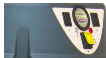
Bouton ON/OFF Indicateur d'état de batterie