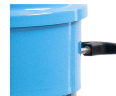
Système de décolmatage ergonomique