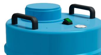
Bouton ON/OFF Indicateur de colmatage