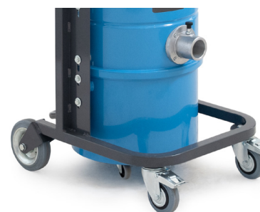
Châssis robuste avec roues de grand diamètres et freins