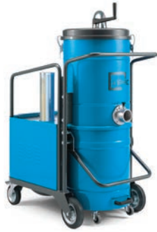
KB2 KB4S KB5S KB3 KB4P KB5P