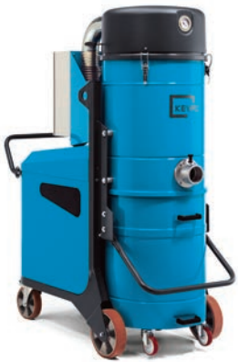
K7 K11S K13 K9 K11P K15