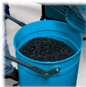
Ingénieux mécanisme de déverrouillage du bac

Certification de filtration L-M-H (pour l'aspiration de poudres toxiques)