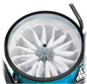
Filtre étoile à grande surface