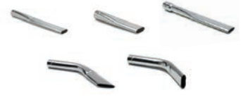
Lances plates en acier zingué et INOX