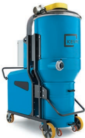
K7/78 K11P/78 K15/78 K9/78 K13/78 K18/78