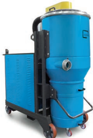
K20S K25S K20P K25P

Puissant, silencieux, robuste, efficace : équipé d'une unité d'aspiration triphasée, insonorisée, sans entretien, pour une utilisation continue 24H/24.