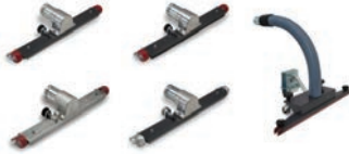
Capteurs mobiles et fixes