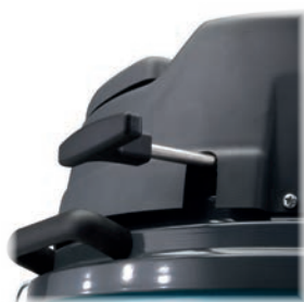
Système de décolmatage ergonomique et efficace