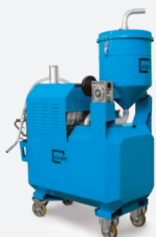
KOIL440T KOIL455T KOIL611T