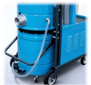
Équilibre de vide pour ensachage direct en sac plastique (en option)