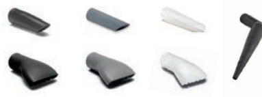
Capteurs coniques et plats en PVC et silicone