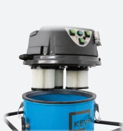
Cartouches filtrantes en polyester hydrofuge montées sur KMB3.069 et KMB3.070