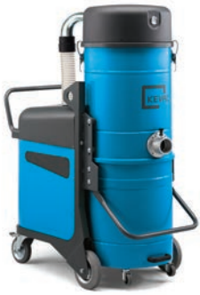
K2 K4S K5S K3 K4P K5P