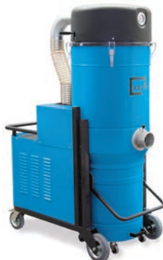
KB5XP KB7S KB7P