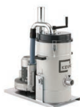
KH0528 KH1028 KH1036 KH1636 KH2236 KH2246 KH3046 KH3046P