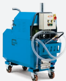
KOIL330 KOIL340 KOIL355