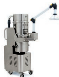
KF16.003 avec bras avec cloche d'aspiration