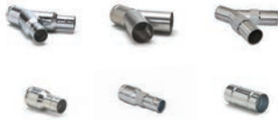
Réductions et raccords pour flexible