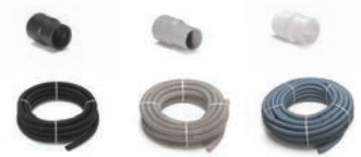
Manchons et flexibles