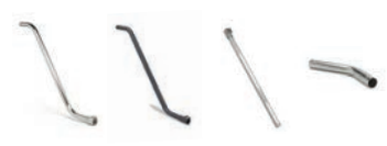
Manicles et rallonges