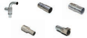
Autres connecteurs, raccords et réductions