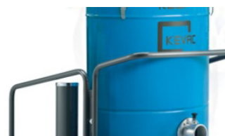
Grande chambre filtrante / surface filtrante de 3.5m 2