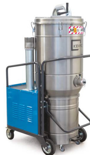
OPTION : Cuve et Chambre filtrante en INOX