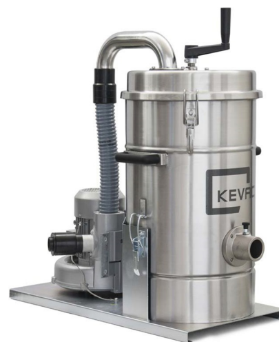
Version tout INOX