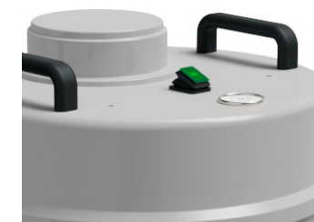
Bouton ON/OFF indicateur de colmatage