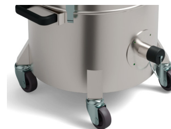
Roues multidirectionnelles Embouchure 40mm