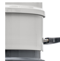
Secouage ergonomique (optionnel)