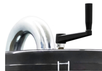
Poignée de décolmatage