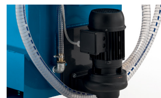
Pompe de refoulement