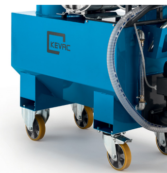
Fourreaux de fourches