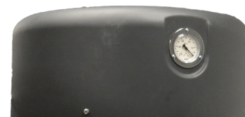
Indicateur de colmatage