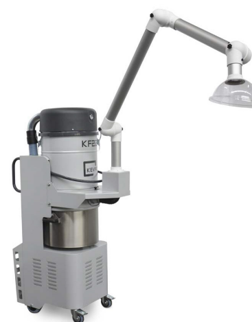
OPTION : Bras d'aspiration