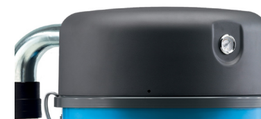
Indicateur de colmatage