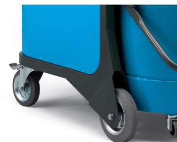
Châssis robuste avec roues de grand diamètres et freins