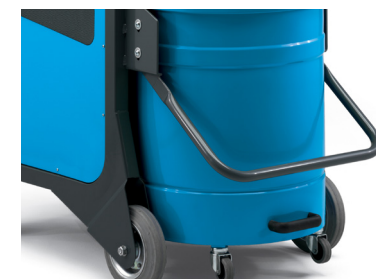
Cuve de 90L sur roues avec système de décrochage par anse, disponible en inox