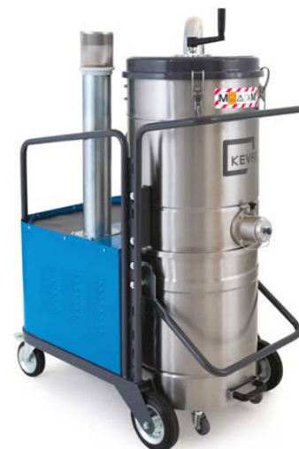
Cuve et Chambre filtrante en INOX