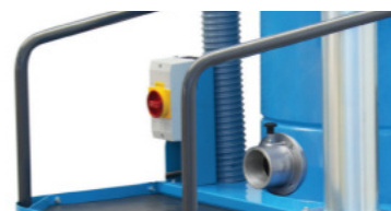
Bouton ON/OFF et embouchure côté tablier