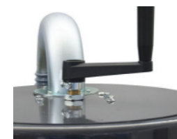
Poignée de décolmatage